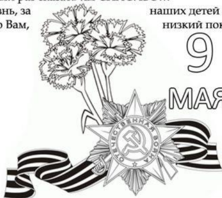
Аппликация из салфеток «Салют»